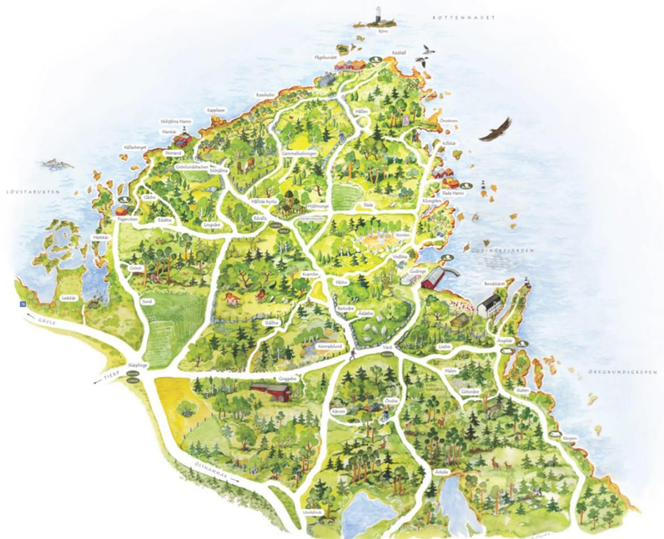
Tecknad karta över Hållnäs. Illustration: Margareta Nordqvist & Staffan Söderlund (egen bearbetning)

I Hållnäs anordnas På tur i Hållnäs årligen. En helg i augusti öppnar byar och föreningar upp och bjuder in till olika arrangemang som lockar många besökare till Hållnäs. Även Hållnäs marknad anordnas i augusti och ses om ett populärt besöksmål.